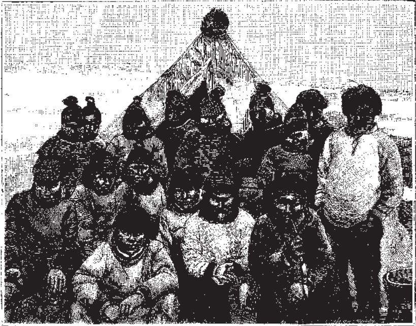
Umiani inuttat 1884

Ilgisanimi eqqarsaatigai, “Ilissi usornaqaasi” oqartarpoq, “uangami kisima nuliara qitornakkalu qimappakka” aammami kalaallit akornanni qaqutigoorluinnarpoq angutip pilersuisuusup taama sivisutigisumik nuliaminik meeqqaminillu qimassimanninnissaa. Hanseeqqap kuisimangitsunik ajoqersuiartorluni Tunumut aallarniarnera Kalaallit Nunaanni pilliuteqarnertut isigineqarpoq.